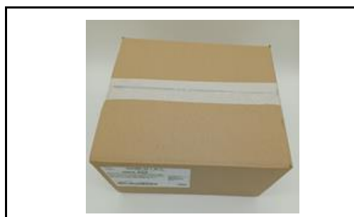
Caja con film protector